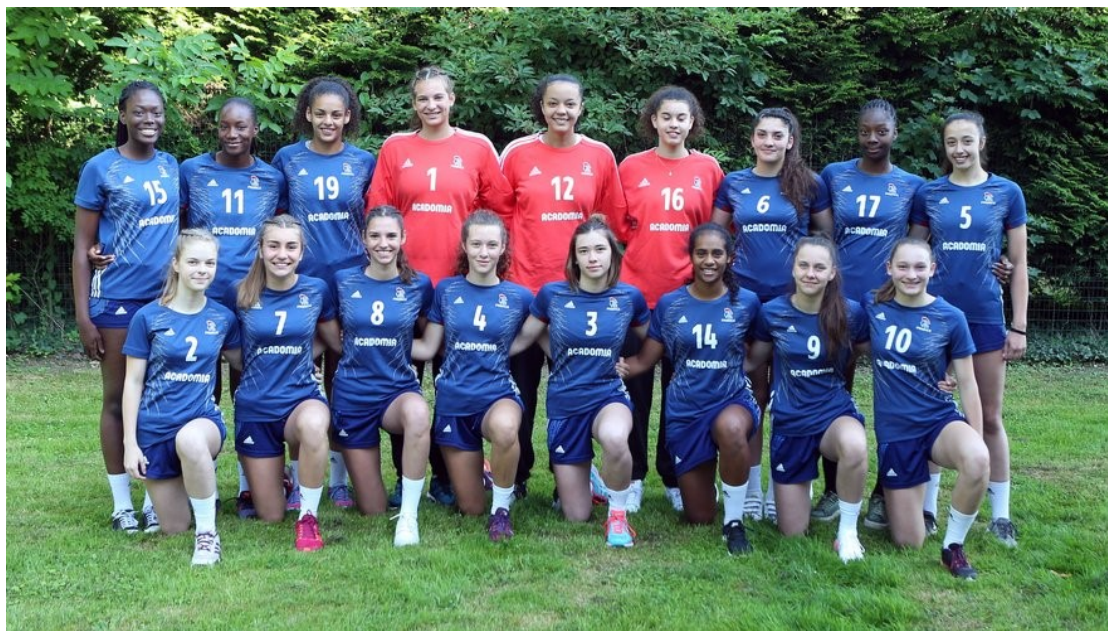
▲ Photo officielle de l'équipe de France U18 féminine.